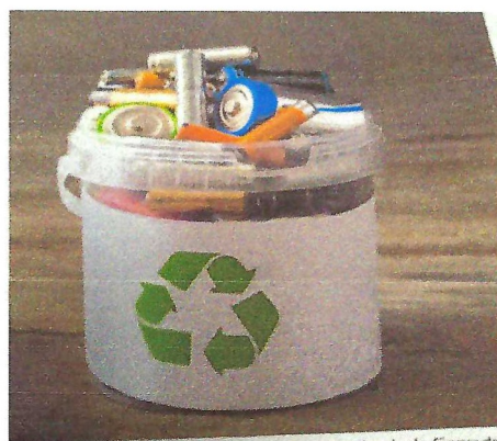
...samma ut om hur du ska förvara de